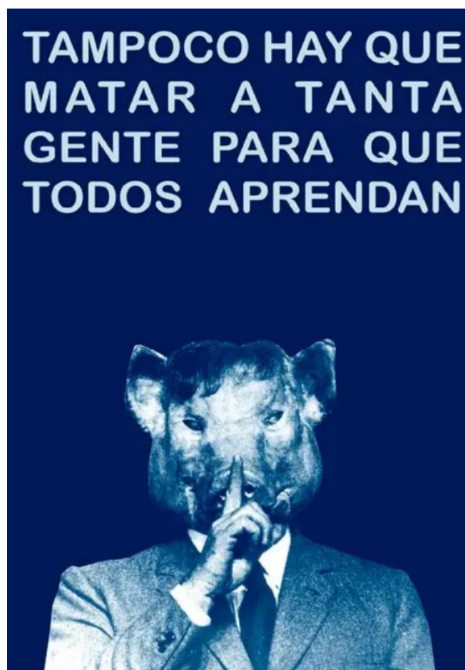
Tampoco, 2025. Rogelio López Cuenca obra para la exposición GENOCIDIO