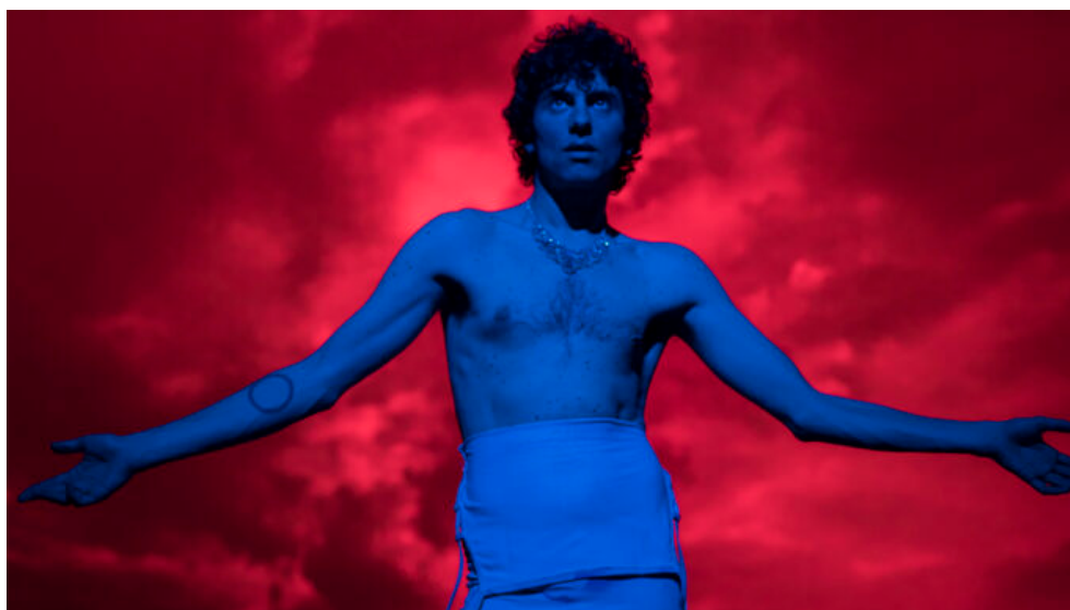
'El ardor', d'Alberto Cortés

Pels marges de la cartellera desfilen artistes que fan ressonar la poesia entre els murs dels teatres Auca#109